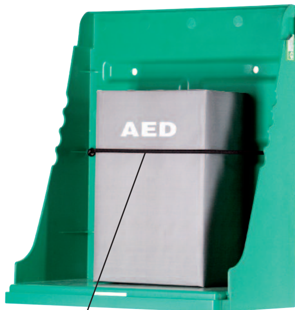
Haltegurte für den DAE

Abmessung H = 400 mm, L = 341 mm, T = 198 mm, Gewicht = 1,5 kg