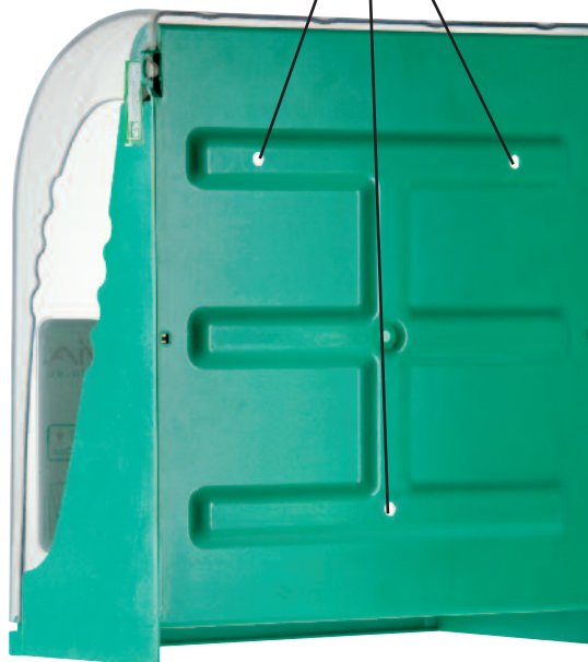
Bohrlöcher für die Wandbefestigung Ø 8,5 mm

PYRES.COM Mas des Tilleuls 66680 Canohès - FRANCE Tél : +33 (0)4 68 68 39 68 Fax : +33 (0)4 68 68 39 69 aivia@pyres.com www.pyres.com